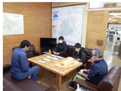
職場体験前の説明（二人とも緊張の面持ちです）

支署では2日間、現場見学や苗木の植栽、また、ドローンを使用した空中撮影、また、保育作業である枝打ち等の体験を実施しました。