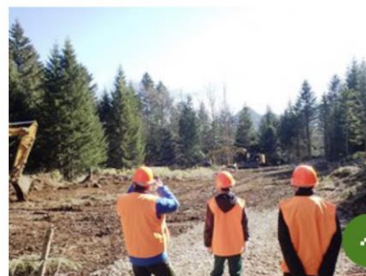
生産現場での見学（ハーベスタの作業に興味深々）

始めて見る生産現場の土場ということもあり、「ひろ～い！」という感嘆の言葉と合わせ、生産事業の説明に大変興味を示していました。